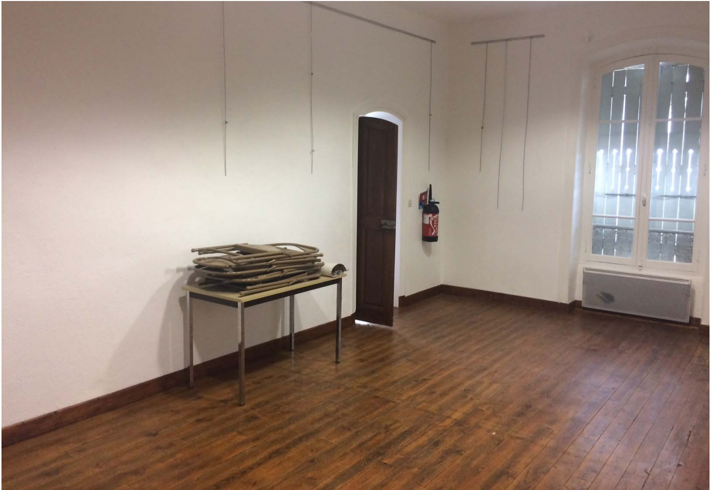
salle 2 (petite salle)