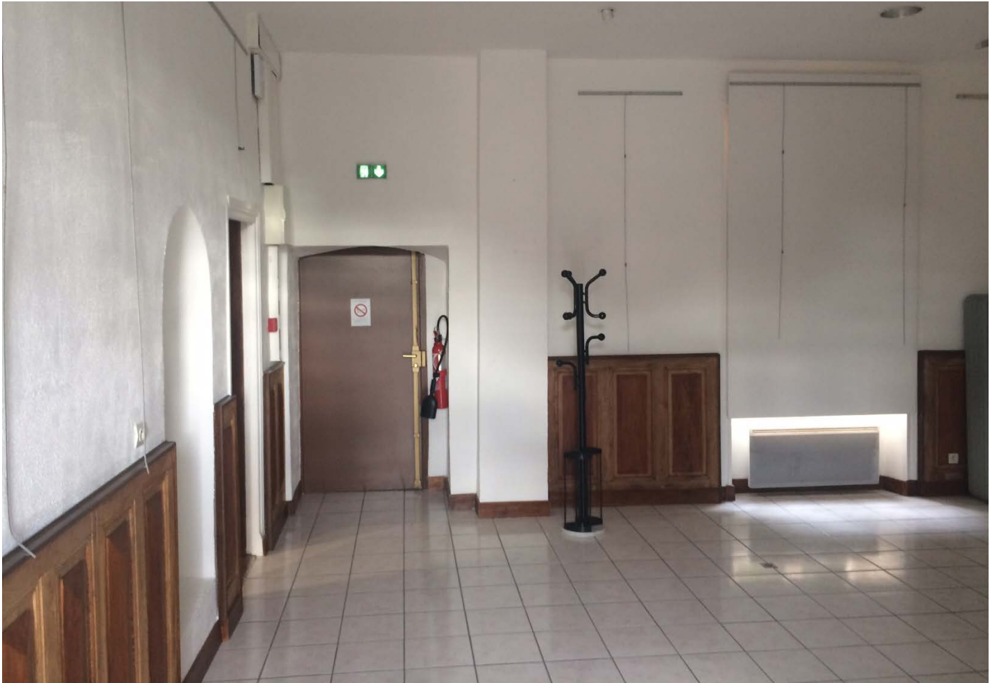
salle 1 (grande salle)