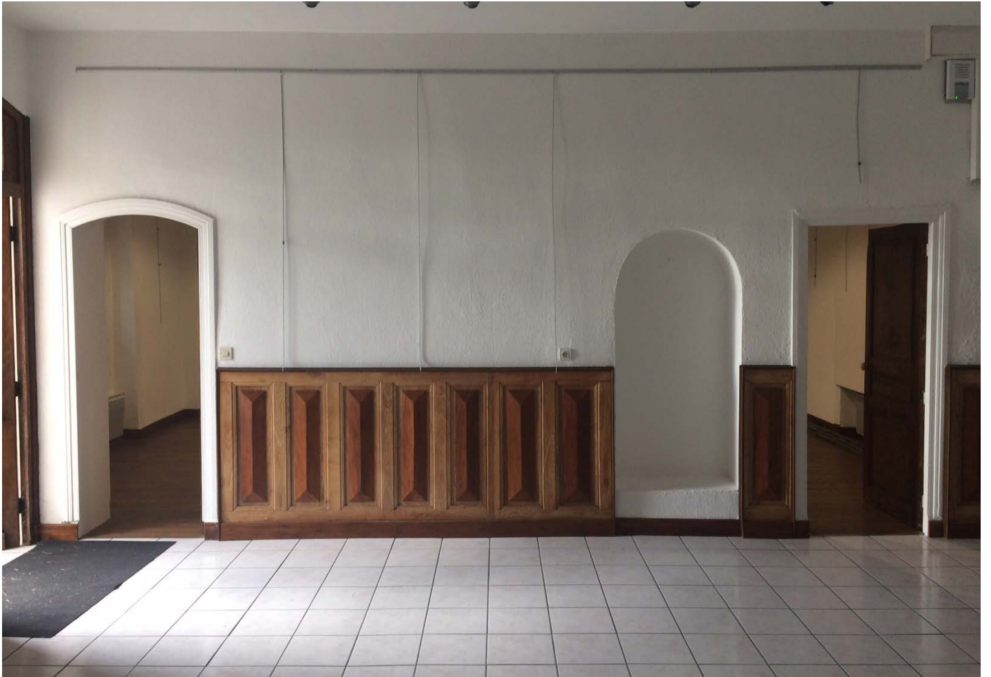
salle 1 (grande salle)