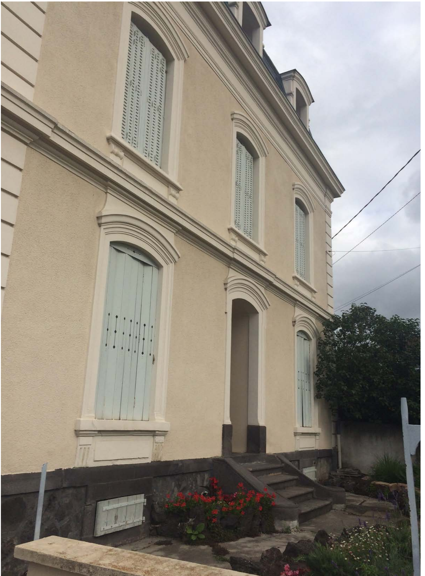
entrée de la Salle Trilloux